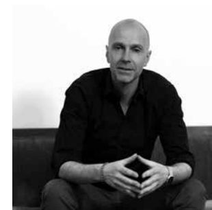
Design: Arge 2 | Michael Spindler, Georg Kaserer

Inspiziert von der Skiindustrie - eigentlich naheliegend für ein Unternehmen aus den Alpen.