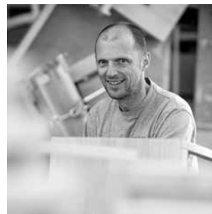
Design: Peter Hussli